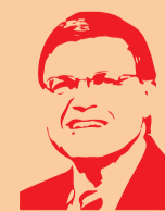
Ernst Hirsch Ballin

Begrip tonen zonder daar naar te handelen, leidt tot steeds meer ongenoegen. Werkelijk begrijpen en daadwerkelijk daarnaar handelen is veel moeilijker, maar wel nodig. Bestuurders die dat opbrengen, hebben meer toekomst dan degenen die terwijl ze begrip tonen, onbegrip oproepen.